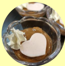
⑥お好みで生クリームなどトッピング