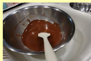
③チョコレートを溶かします