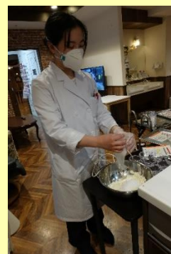
④お豆腐とチョコレートと砂糖を混ぜます