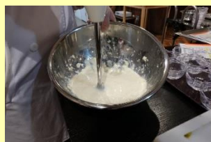
②お豆腐をもっとなめらかにします