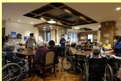
みなさんは、リハビリ課のメンバーと一緒に口周りの体操をしました