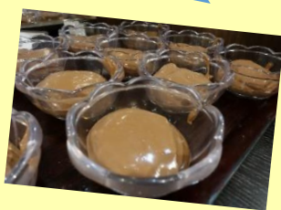
⑤かわいい器に取り分けて