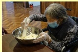
①みなさんと一緒にお豆腐を細かくつぶします